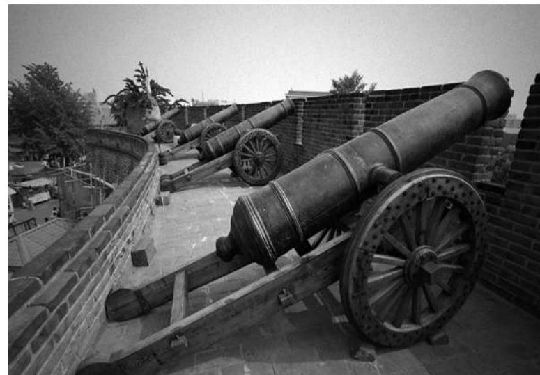
红夷大炮是前装滑膛炮，射程可达四五里至七八里不等。