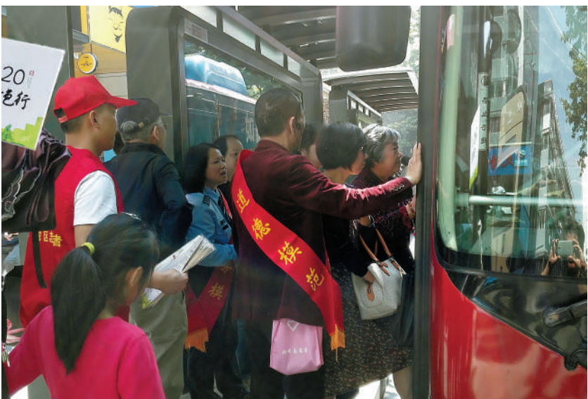
昨天,在杭州公交武林门车站,身披大红绶带的志愿者在引导乘客有序乘车。杭州正在喜迎 G20 峰会,人们的精神风貌和城市面貌都在发生变化。近日,来自杭州各行各业的万名劳模先进、职工志愿者,在公交站点引导排队、呼吁礼让,进一步提升杭州这座美丽城市的文明水平。