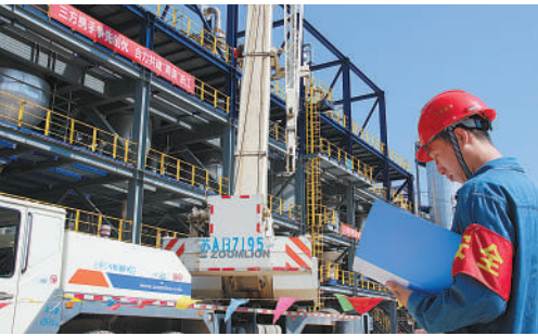
宁波大榭石化在建现场

送保障、送健康等, 进一步凝聚立功竞赛的正能量。部分参赛项目还把建设单位信用积分制度引入竞赛内容, 将竞赛成果纳入重点工程诚信加分项, 竞赛活动有了刚性激励机制。