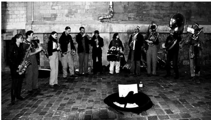
路边卖艺的前南斯拉夫波斯纳电影制片厂乐团团员们。

山脚下有一支十几名男青年组成的乐团在演奏,据说他们是原南斯拉夫波斯纳电影制片厂乐团,曾经为上百部电影演奏过主题歌。乐队前面的地上,放着一个大布袋,游客放5欧元,就可拿走一张他们原先演奏