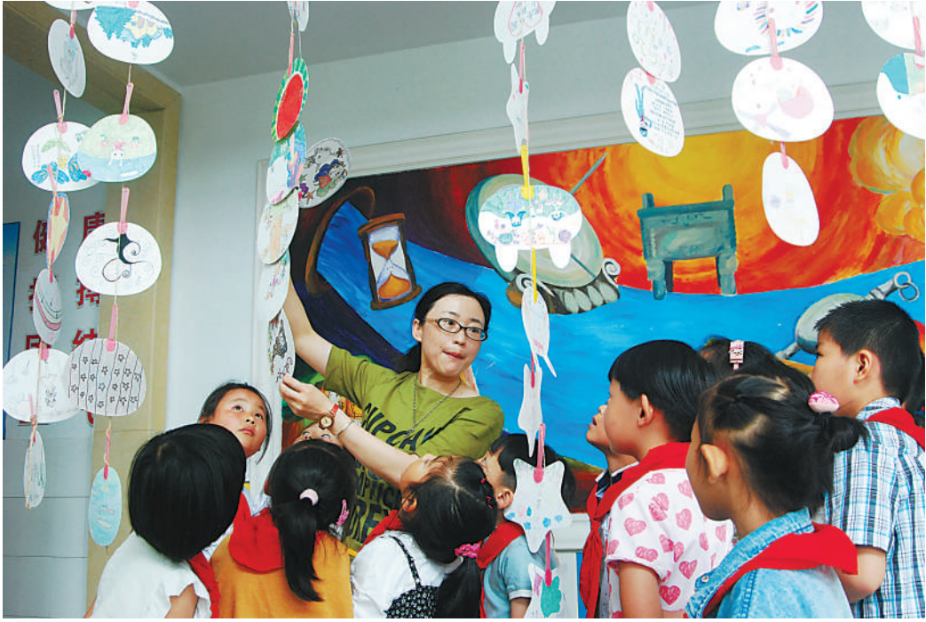
6月16日,建德市明珠小学将学生们围绕“喜迎G20峰会”这一主题制作成的扇面画作品,悬挂在学校大厅里供师生们共同欣赏。近日,该校组

织1000多名学生利用小小扇面题诗作画,既增加了学生对G20峰会的了解,又诠释着他们对扇面文化的理解。