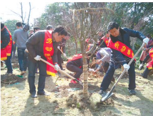
组织下城区部分劳模参加市总工会劳模(先进)植树活动