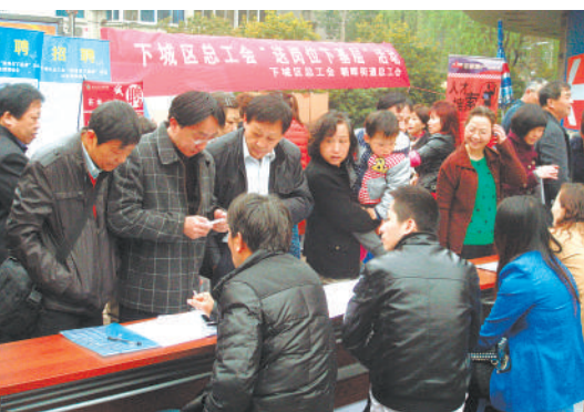
下城区总工会送岗岗下基层