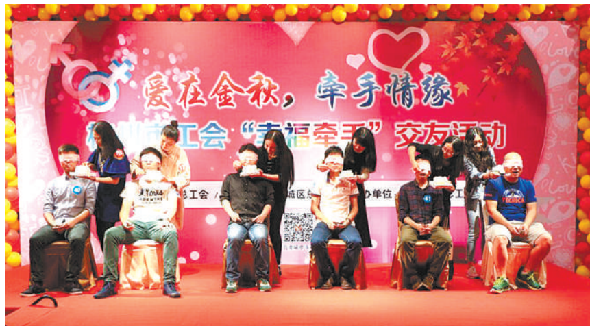
“幸福牵手”交友活动在城开幕