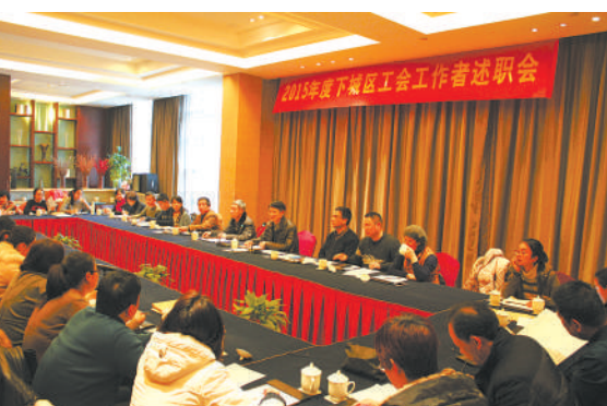
下城区工会工作者述职会