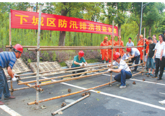
防汛排涝技能竞赛