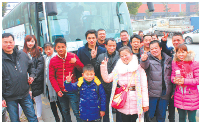
下城区总工会助外来务工人员“平安返乡”