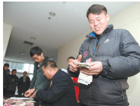
通过维权,职工拿到了自己的血汗钱