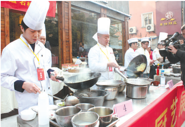
下城区职工比拼厨艺技能