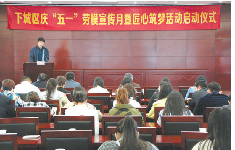
下城区启动匠心筑梦活动