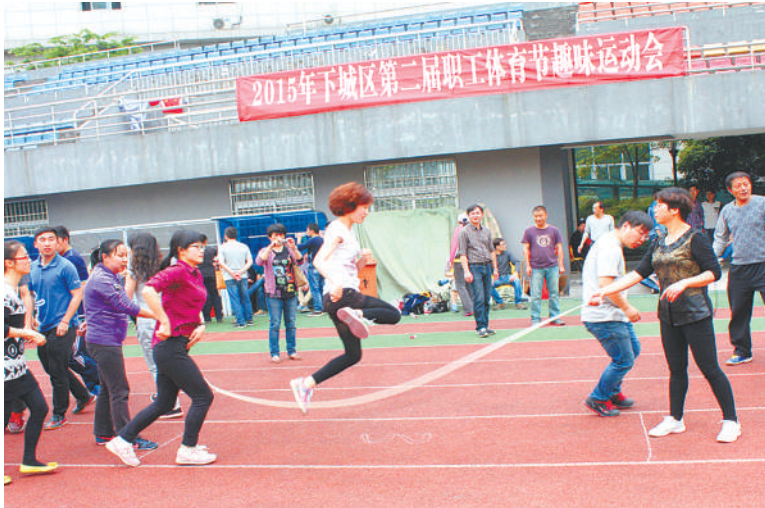
下城区总工会举办“第二届职工体育节”趣味运动会