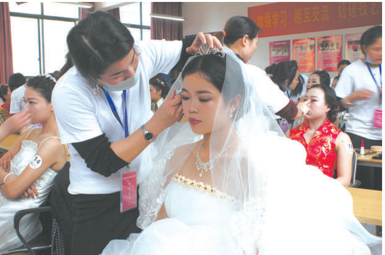
创新创业 增“色”添“彩”——下城区美容师职业技能竞赛圆满落幕