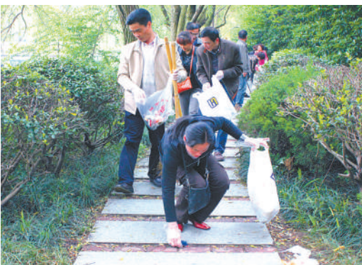
下城区总工会引导劳模(先进)和广大职工积极投身“五水共治”行动