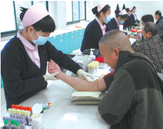
下城区总工会组织劳模体检