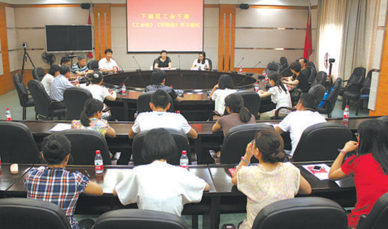
工会干部参加《工会法》《劳动法》学习笔试

目前,下城独立建会企业集体合同、工资专项集体合同签订率达98%以上,其中规模企业工资专项集体合同签订率达100%,区总工会也连续三年在杭州市工资集体协商成果展中获得第一名。