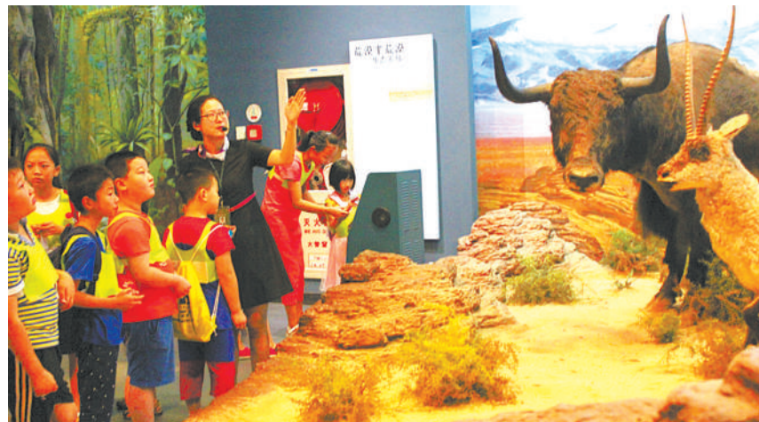
下城区总工会举办“小候鸟”暑期系列活动