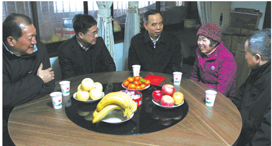
中华全国总工会副主席陈荣书走访慰问下城全国劳动模范