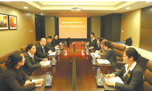
企业召开工资集体协商会议