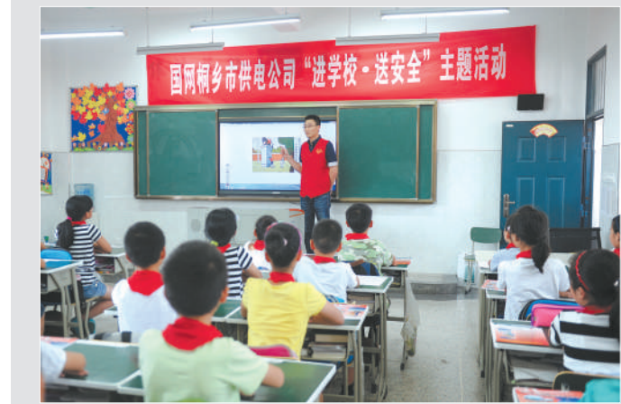
桐乡供电：暑期安全用电送校园