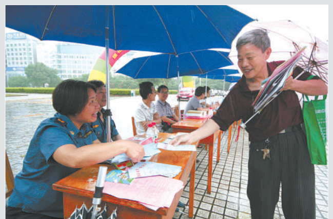
永康交通“设摊”送安全

今年6月份，永康市交通运输局“全国安全生产月”活动精彩纷呈。近日，该局专门组织路政、运管、交通安全等部门的工作人员在市五金广场“摆摊设点”，向市民进行相关政策、法规、法律的宣传，并且对前来咨询的市民耐心细致地进行解答，使道路运输、公路及路政管理等法规进一步深入人心，增强人民群众的安全意识。 林加强 朱伟强