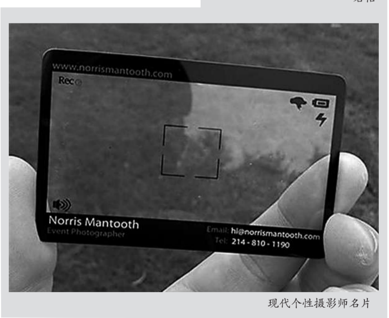
现代个性摄影师名片

从形式看，改革开放后的名片基本是一人一(名)片，不过也有例外，我曾收到过一张双人名片，分别印着夫妻双方的职务、职称和联系方式，这是主人公夫妻借着名片秀恩爱，因此被称作“鸳鸯名片”。从内容看，名片主要印上职务、职称(头衔)和联系方式。一些人为了获得社会信任和尊重，就印上许多虚虚实实的职务。我见过最夸张的一张名片印了几十项职务(头衔)，正面印不下即反面，