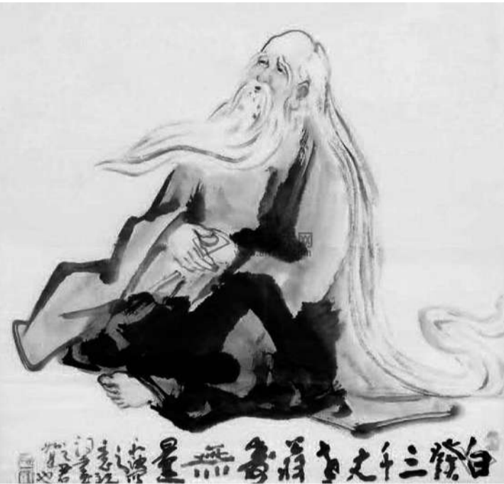
白发三千丈，缘愁似个长

目就是《春晓》，但至少不要被“春晓”干扰了我们理解诗意。从诗意本身来看，“春晓”比“春晓”更合适。孟浩然在诗中想表达的是“惜春”、“惜花”之情，而不是春天早晨的困倦和思绪。而“春晓”的意思，就是晚春、暮春，就是“花落知多少”的时节。“春晓”呢？无论是武元衡的《春晓闻莺》及相关唱和之作，还是元稹的《春晓》、温庭筠的《春晓曲》，这些以“春晓”为题目的诗，主要描写的都是早晨起来对远人或对往昔的思念，侧重于晨起之思。而孟浩然的“春眠不觉晓”，是伏笔和铺垫，他最关心的是“春晓”，是春天的不知不觉的离开。这才是“诗眼”。