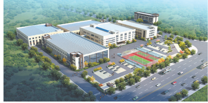
江山市电商产业园