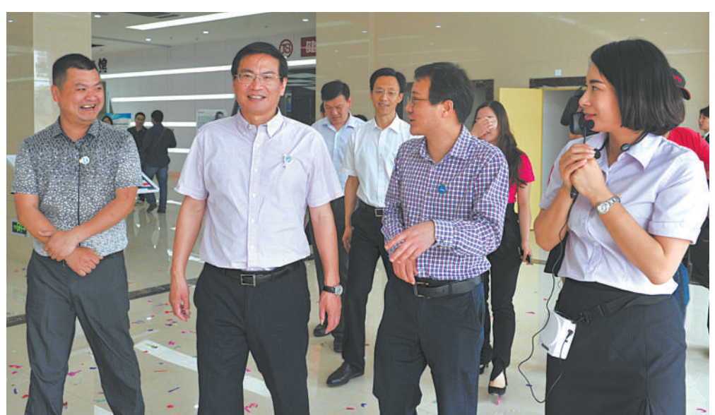
江山市委书记吕跃龙参观电商园

浙江省江山经济开发区是1994年8月经省政府批准设立的省级经济开发区,2005年12月通过国务院设立审核。2006年11月经省委、省政府确认为首批“山海协作示范区”,同时也是省科技厅授牌的“浙江省星火示范园”,2013年与绍兴市柯桥区共建成立“江山—柯桥山海协作产业园”。空间格局为“一城三园”(即:城南新城、莲华山工业园、江东工业园和高新技术园),总规划面积80平方公里,完成开发建设面积20平方公里,现有熟地3400亩,其中莲华山工业园2200亩,高新技术园400亩,城南新城800亩。主要发展输配电、照明电器两大主导产业,门业和消防器材两大特色产业及战略性新兴产业。截至2015年,园区规模工业企业126家,亿元以上企业55家,其中10亿元以上企业3家;共有国家级高新技术企业19家,中国驰名商标4个,省级知名品牌(商标)42个。