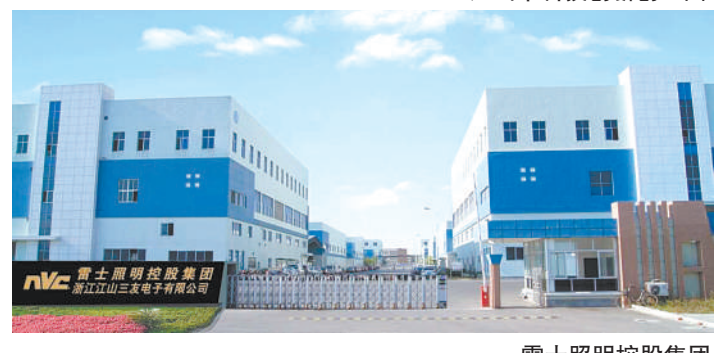
富士照明控股集团