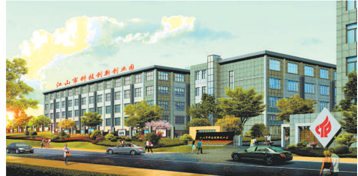
江山市科技创新创业园