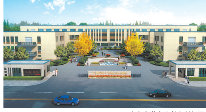
江山市小微企业创业创新园