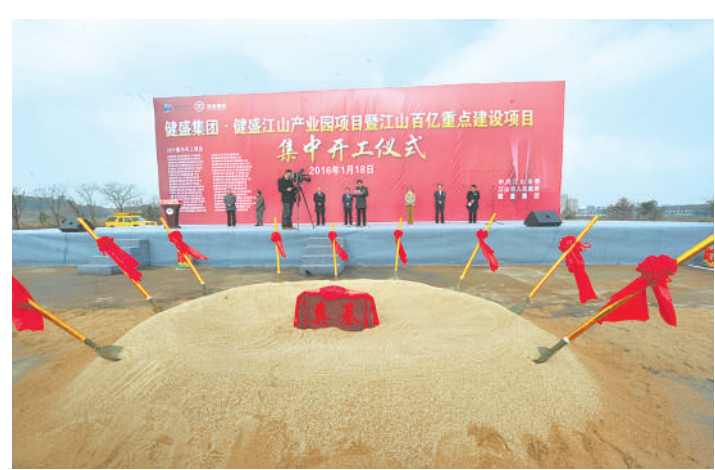
健盛产业园动工仪式

开发区要实现跨越式发展,关键在于企业快速做大做强,在于产业的规模扩张。因此,江山经济开发区按照“聚产业、强企业、重资本”的工作思路,出实招、下功夫,不断推进扶强培优工作上档次,进一步发挥龙头带动和产业集聚效应。力争全年完成工业总产值230亿元,同比增长12%;完成规模以上工业产值206亿元,同比增长15%。一是加强帮扶企业深度。进一步转变工作作风,按照“三待三亲”理念,建立开发区“金种子”工程,筹措资金用于企业腾笼换鸟、帮扶解困等工作,年内重点要完成一批企业老厂房收储工作,为企业强化资金、土地、用工等要素方面保障。进一步深化服务内容,切实加强在企业科技创新、品牌专利、人才引进、技术改造等转型升级方面的政策扶持和服务指导工作,全力加快开发区企业提质增效,促进企业转型升级。二是加大培育龙头企业力度。只有大企业才有大产业,根据现有企业情况,建立龙头企业和单打冠军培育梯队,积极培育一批行业龙头企业和单打冠军企业,根据市里的相关政策,开发区配套制定出台扶持龙头企业和单打冠军发展的激励政策,并每年开展开发区制造业十强企业评选,切实发挥龙头企业引导、示范作用,全面推进行业整体提升发展。2016年力争完成新增规上企业10家、亿元以上企业5家、10亿元以上企业1家。三是加快培育上市企业进度。引导企业建立现代企业制度,形成“产权清晰、权责明确、管理科学”新型规范企业,实现可持续发展。按照“五个一批”的要求,做好上市企业梯队建设,鼓励有条件的企业上主板或新三板,根据上市程序做好指导和帮扶工作,不断提升开发区企业综合竞争力,2016年力争实现新增上市企业2家。