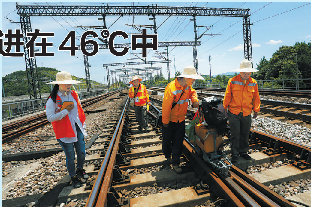
本报女记者(左一)体验钢轨探伤工高温作业。

天窗)进行,当天有两个“天窗”:凌晨3:30至5:30,中午11:30至13:30。“今天有风,天气还算不错。”徐刚从业21年,经验丰富,高温天作业,有风的日子就是好天气。走了还不到一公里,他的后背已经湿透了。