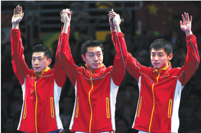
马龙、许昕和张继科(从左至右)在颁奖仪式上向观众致意。

运会团体取代双打成为乒乓球比赛项目以来,这是国乒继2008年和2012年之后连续第三次包揽奥运会单打和团体四枚金牌。