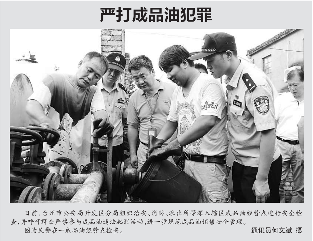
日前,台州市公安局开发区分局组织治安、消防、派出所等深入辖区成品油经营点进行安全检查,并呼吁群众严禁参与成品油违法犯罪活动,进一步规范成品油销售安全管理。