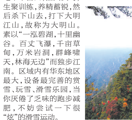
大明山之秋层林尽染

相传朱元璋于此山屯军千亩田,招兵买马,生聚训练,养精蓄锐,然后杀下山去,打下大明江山,故称为大明山。素以“一泓碧湖,十里幽谷。百丈飞瀑,千亩草甸,万米岩洞,群峰啸天,林海无边”而独步江南。区域内有华东地区最大,设备最完善的赏雪、玩雪、滑雪乐园,当你厌倦了乏味的跑步减肥,不妨尝试一下很“炫”的滑雪运动。