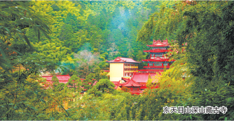
东天目山深山藏古寺

东天目山是佛教圣地,自古有“八方香客云集来。十万烟火散江南”的美誉,景区内东瀑和西瀑可谓极其壮观,东瀑垂直落差达到90米,西瀑由山崖叠叠而下,总落差350米,被誉为“江南黄果树”。目前景区已建成东瀑大峡谷、西瀑大森林、昭明大禅院、天目大仙境四大景区。