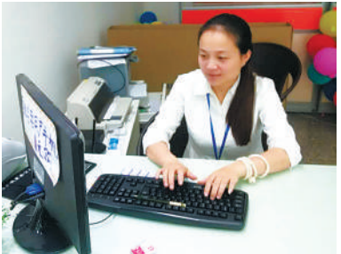
每个顾客,傅萱都用心对待。

记者洪茵婷报道 “阿姨,这款手机现在活动售价99元,还送30元话费,相当于只要69元。如果有任何问题都