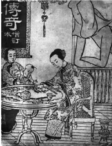
张爱玲的第一部小说集《传奇》