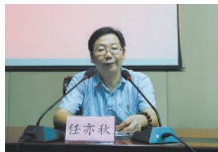
省人大常委会法工委副主任任亦秋授课。

本报讯 记者阮向民报道 《浙江省工会劳动法律监督条例》(以下简称《条例》)将于12月1日起正式施行。昨天下午,省总工会举行专题学习会,邀请省人大常委会法工委副主任任亦秋就《条例》的立法背景和主要内容作出解读。