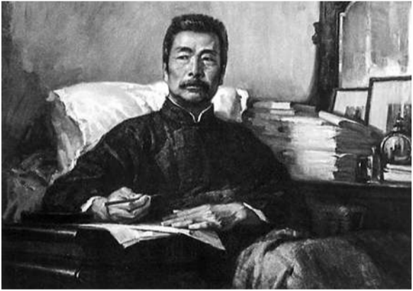
鲁迅先生(1881年9月25日~1936年10月19日)

生活的热爱,总会时不时地从文字里头溢出来:“河边枯柳树下的几株瘦削的一丈红,该是村女种的罢。大红花,都在水里面浮动,忽而碎散,拉长了,如缕缕的胭脂水,然而没有草。茅屋,狗,塔,村女,云……也都浮动。大红花儿一朵朵全被拉长了,这时是泼刺奔进的红绸带。带织入狗中,狗织入白云中,白云织入村