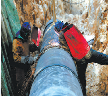
条件再恶劣,安全生产等制度也要被扎实落实。