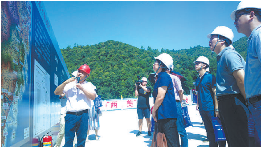
2016年8月25日,浙江省、台州市总工会领导到三门分输站检查指导工作。