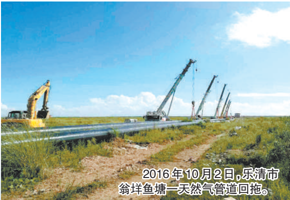
2016年10月2日,乐清市翁垟鱼塘一天然气管道回拖。