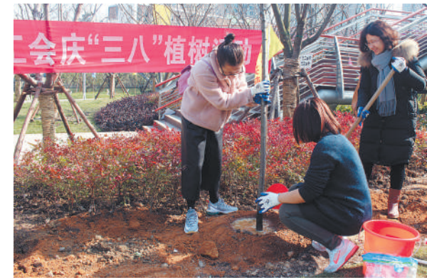
宁波市建设工会女职工委员会连日来组织100多位企事业单位女职工到当地樱花公园,用植树造绿的方式,喜庆“三八节”。