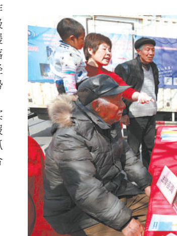
巾帼宣讲团进社区现场答复有关妇女维权的问题

的“三优先”服务。对符合法律援助条件的妇女,实行“四个当日”工作制,从受理申请到指派律师一次性办妥,保证受援妇女当天就能和自己的援助律师见面获得帮助。对行走不便的妇女,提供上门服务,真正落实绿色通道要求;组团专业服务。成立由丰富经验的女性律师、公证员、司法鉴定人员组成的“法润