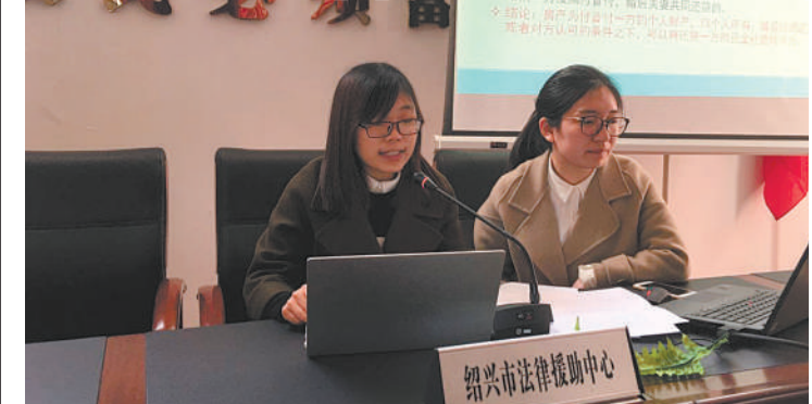
法律援助志愿律师下基层宣讲婚姻家庭法律知识

本报讯 3月4日,绍兴市越城区戴山街道龙洲社区龙池舞台人声鼎沸、热闹非凡。绍兴市司法局、绍兴市妇联联手推出的2017年法律援助“巾帼维权工程”在此正式启动。