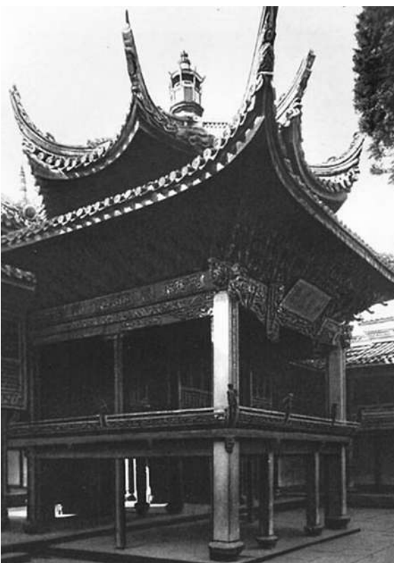
宁波福建会馆戏台