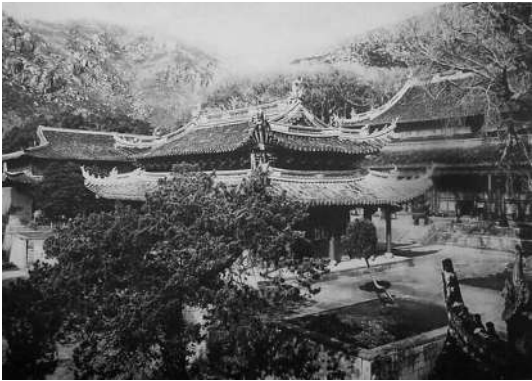
普陀山法雨寺主殿