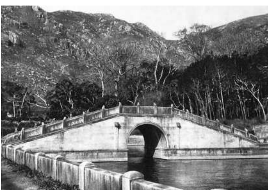
前往普陀山法雨寺经过的石桥