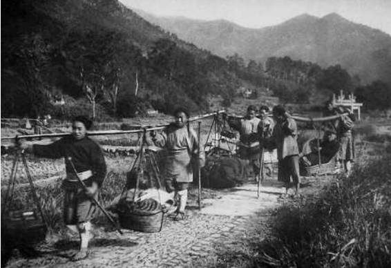
乡民前往天童寺途中