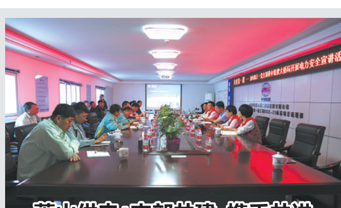
萧山供电:支部共建 携手共进

日前，在中国铁建大桥工程局集团有限公司项目部，国网杭州市萧山区供电公司党支部与该公司党支部开展首次共建活动。当天，萧山供电公司党员进行了安全宣讲，介绍了在施工过程中的安全注意事项。