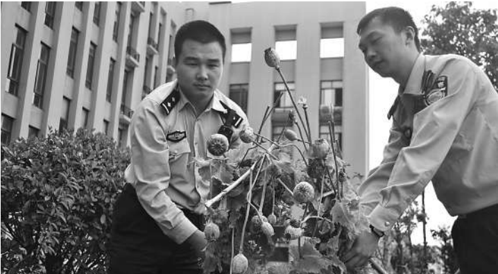
被民警收缴的未成熟罂粟。