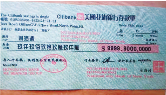
上图:诈骗团伙伪造的境外银行存单