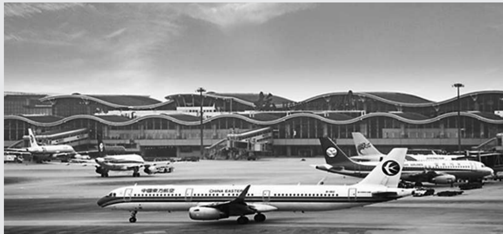
杭州萧山国际机场一景

根据规划,杭州临空经济示范区位于杭州市萧山区东部,规划范围西至杭州绕城高速东线,东至头蓬快速路,北至大江东产业集聚区边界及钱塘江水域,南至萧山区瓜沥镇行政边界,总面积142.7平方公里,其中杭州萧山国际机场面积16.6平方公里。根据“集约紧凑、产城融合、区域协同”的发展理念,杭州临空经济示范区将形成“一心一轴五区”的总体布局。一心指的是杭州萧山