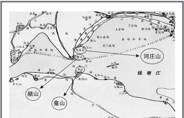
宋时钱塘江江道示意图

新中国成立后,特别是改革开放以后,人民政府从战略高度对钱塘江进行了全面综合治理,投入巨资对钱塘江进行标准海塘建设,还陆续在钱塘江上架起了10座桥梁,建成了2条过江隧道,方便两岸生产生活,彻底杜绝了钱塘江频繁改道、危害沿江生产生活的情况的发生。如今,早已变为陆地的古钱塘江上又将崛起国家级经济示范区,标志着杭州、钱塘江一个全新的时代即将到来——如果你善待母亲河,母亲河也将以其百倍情怀,反哺、造福她两岸的人民。