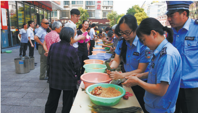
端午前夕,义乌市执法局福田大队联合福田社区举办了包粽子活动。执法队员与市民们一起动手包粽子,一时间粽叶舞动,红丝线穿梭,整个活动现场欢声笑语、其乐融融。