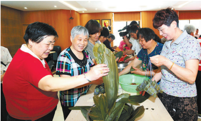
端午佳节前夕,杭州市间弄口街道天杭社区组织了裹粽子比赛,把粽子赠送给工疗站和独居老人。