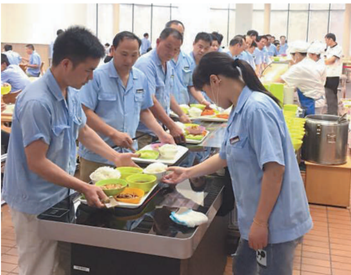
宁波森鹤乐器有限公司职工食堂的智盘系统,盘子一放,价格同步显示。

“车间、食堂、宿舍是不少职工在企业生活工作的‘三点一线’,如何在这些细节上让职工满意,是工会组织一直在努力的方向。”慈溪市总工会有关负责人表示,下一阶段将在继续巩固延伸“示范职工食堂”创建工作成果的同时,还要提炼形成具有慈溪特色的企业“食堂文化”,通过凝聚职工人心,为促进企业和谐发展注入软实力。