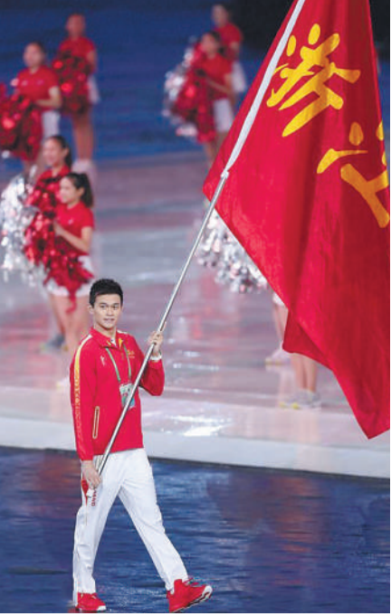
8月27日,浙江体育代表团旗手孙杨在入场仪式上。当日,中华人民共和国第十三届运动会开幕式在天津举行。

战;北京奥运击剑冠军仲满再度出山,2016年宣布退役的举重奥运冠军廖辉也回归全运;在里约奥运会首夺女子单人双桨铜牌的段静莉期待延续荣耀,体操奥运冠军张成龙、老将商春松将面临小将的冲击。