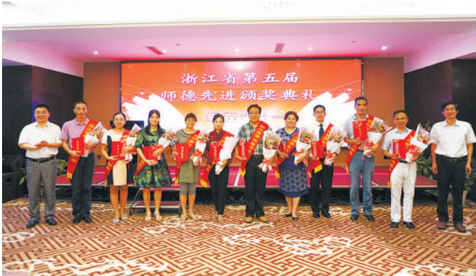
师德标兵上台领奖。