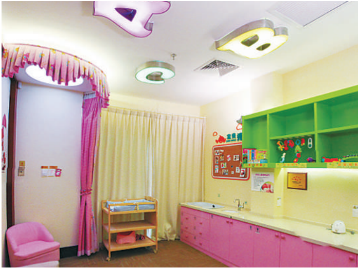
农行温州分行营业部的“妈咪暖心小屋”。

除了农行温州分行营业部的“妈咪暖心小屋”,其他7家获评五星级的“妈咪暖心小屋”,分别位于温州联奥汽车销售服务有限公司、瓯海公共卫生大楼、德力西电气有限公司、乐清市中心幼儿园、瑞安市妇幼保健院、温州海关、温州市人民医院温州市妇幼保健院。