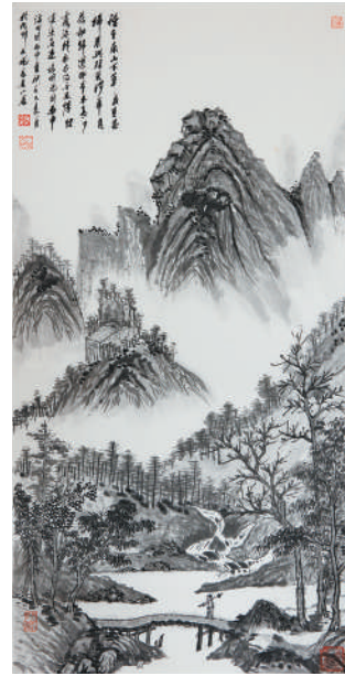
作者绘画作品《种豆南山下》

书作画,在传统的艺术宝库中从容游走,既能培养自己的审美能力、形象思维和逻辑思维能力,又可汲取和积淀儒、道、释的哲学精华,从而燃烧起发现美、欣赏美、创造美的激情。泼墨挥毫抑扬顿挫,笔走龙蛇悠然自得,我从中得到了精神上极大的愉悦。