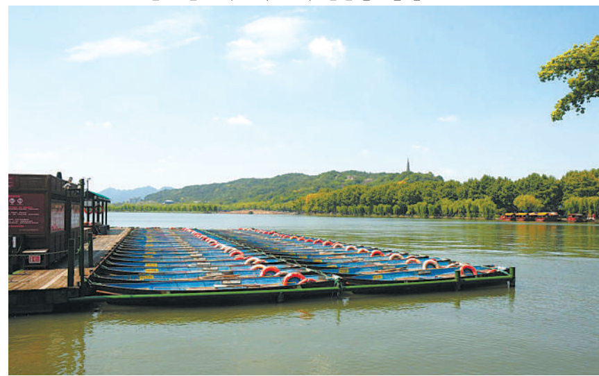
9月14日，为防范台风“泰利”，杭州西湖所有的游船和手划船都停止了营业。