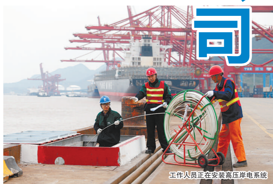
工作人员正在安装高压岸电系统