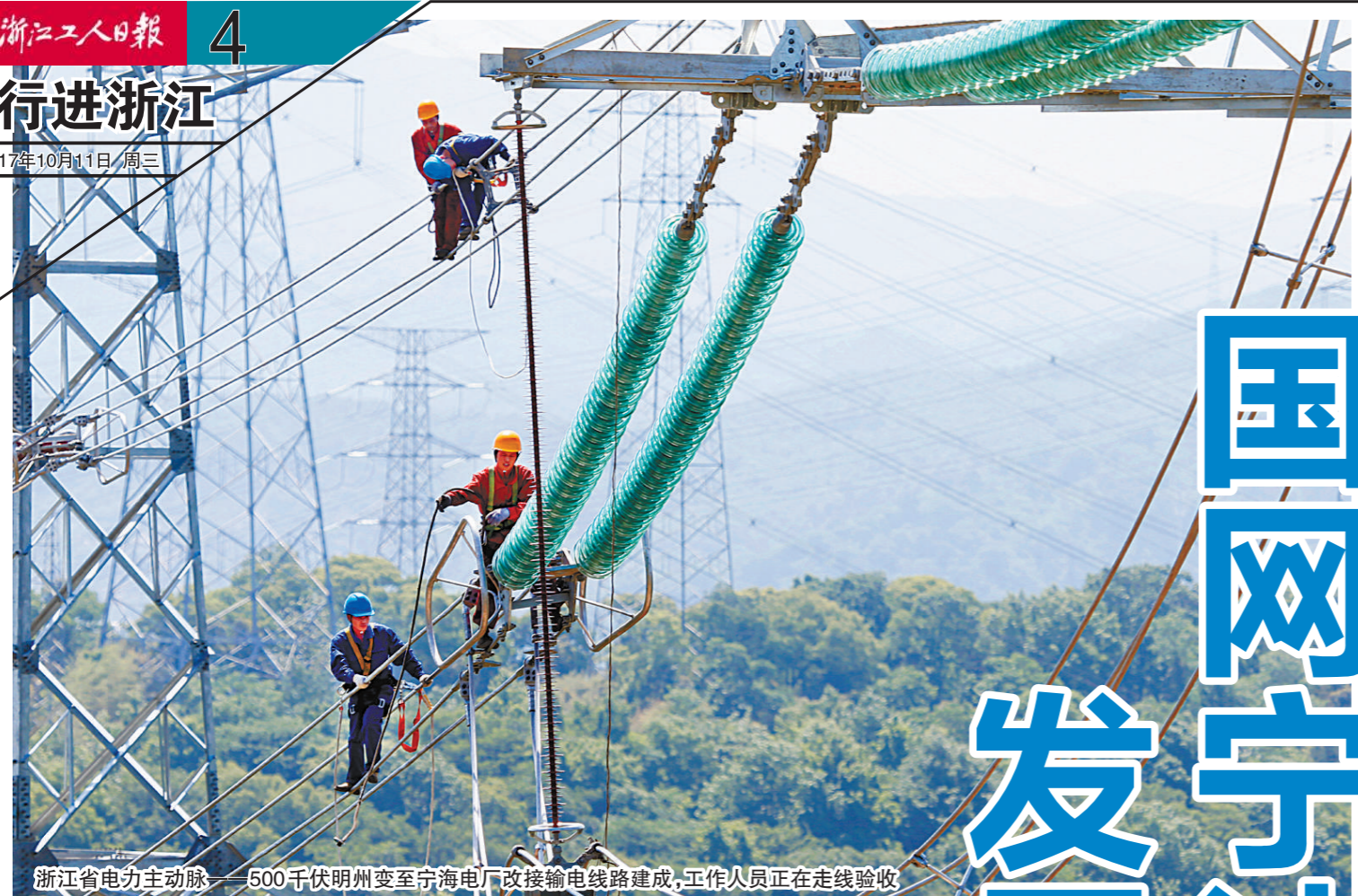
浙江省电力主动脉——500千伏明州变至宁海电厂改接输电线路建成,工作人员正在走线验收