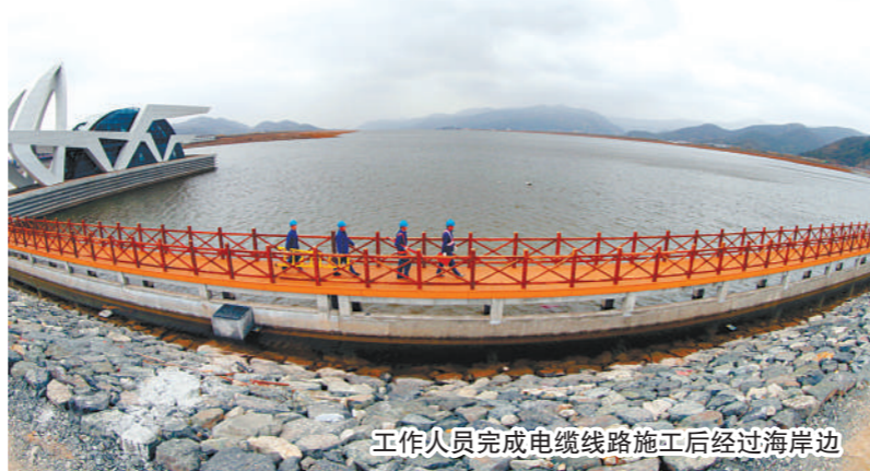
工作人员完成电缆线路施工后经过海岸边