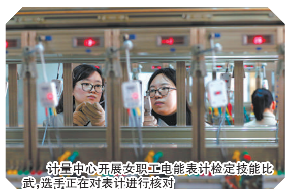
计量中心开展女职工电能表计检定技能比武,选手正在对表计进行核对