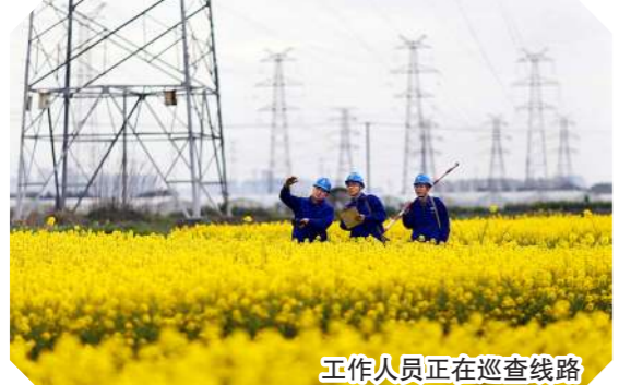
工作人员正在巡查线路