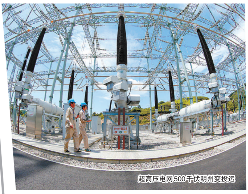
超高压电网500千伏明州变投运