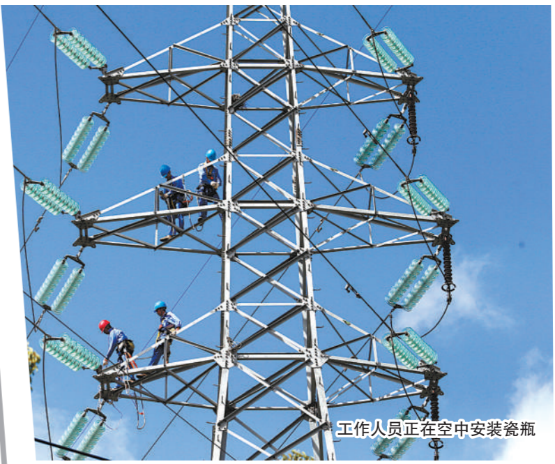
工作人员正在空中安装瓷瓶