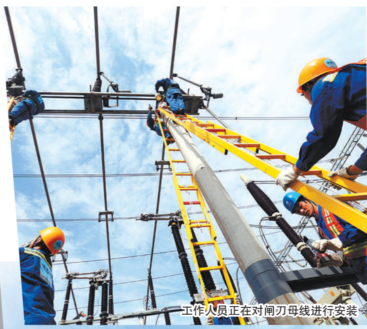
工作人员正在对闸刀母线进行安装