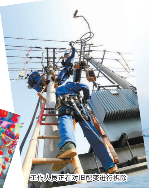
工作人员正在对旧配变进行拆除