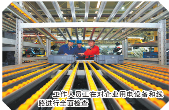
工作人员正在对企业用电设备和线路进行全面检查

今年以来,国网宁波供电公司围绕“打基础,强管理,补短板,争第一”思路,锐意进取、攻坚克难,确保了电网稳定和安全度夏。他们加快电网规划和重点工程建设,举办中德宁波新能源发展合作论坛,世界一流城市配电网建设雏形初显。他们找差距、补短板,不断提升精益化管理水平,提高经营绩效,他们深化“互联网+营销服务”,深推智能电表应用试点,建设“全能型”供电所,公司还成立供电服务指挥中心,整合营配调资源,提升办电抢修服务响应效率,并坚持依法治企,加强企业文化建设,稳扎稳打,奋勇争先,不断开创公司发展新局面,以优异成绩向党的十九大献礼!