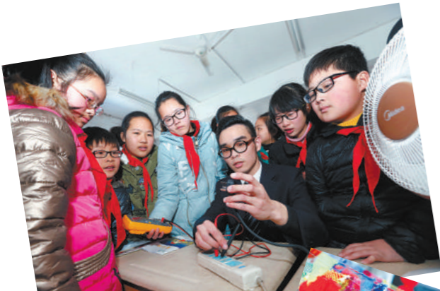
志愿者们正在为小学生讲解安全用电知识