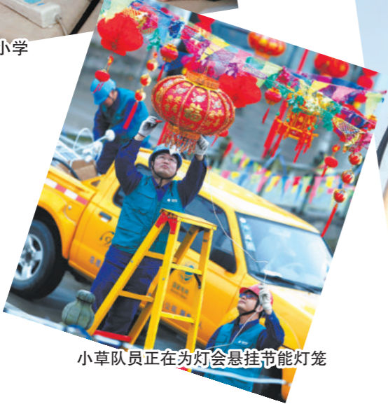
小草队员正在为灯会悬挂节能灯笼