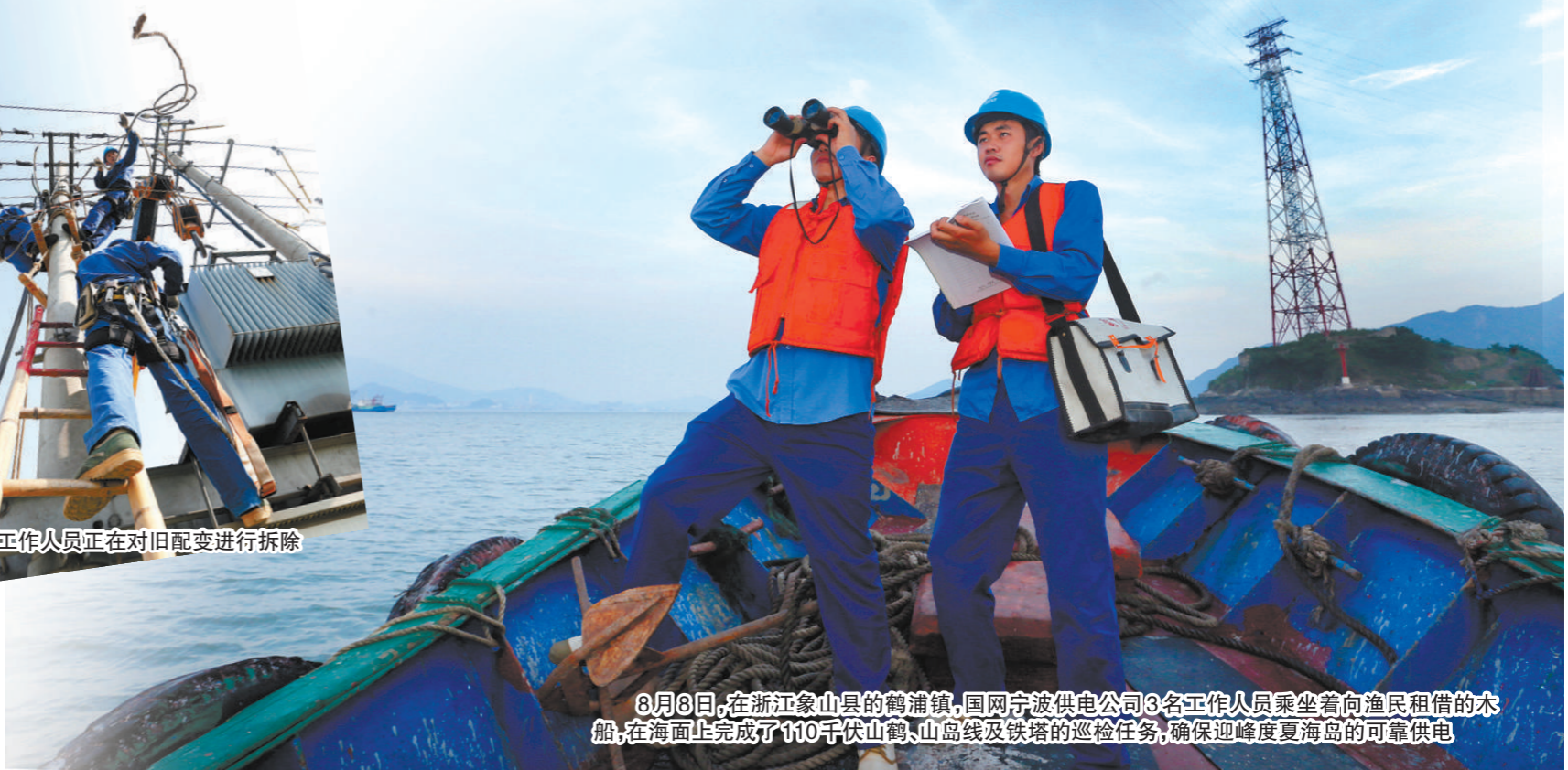
8月8日,在浙江象山县的鹤浦镇,国网宁波供电公司3名工作人员乘坐着向渔民租借的木船,在海面上完成了110千伏山鹤、山岛线及铁塔的巡检任务,确保迎峰度夏海岛的可靠供电