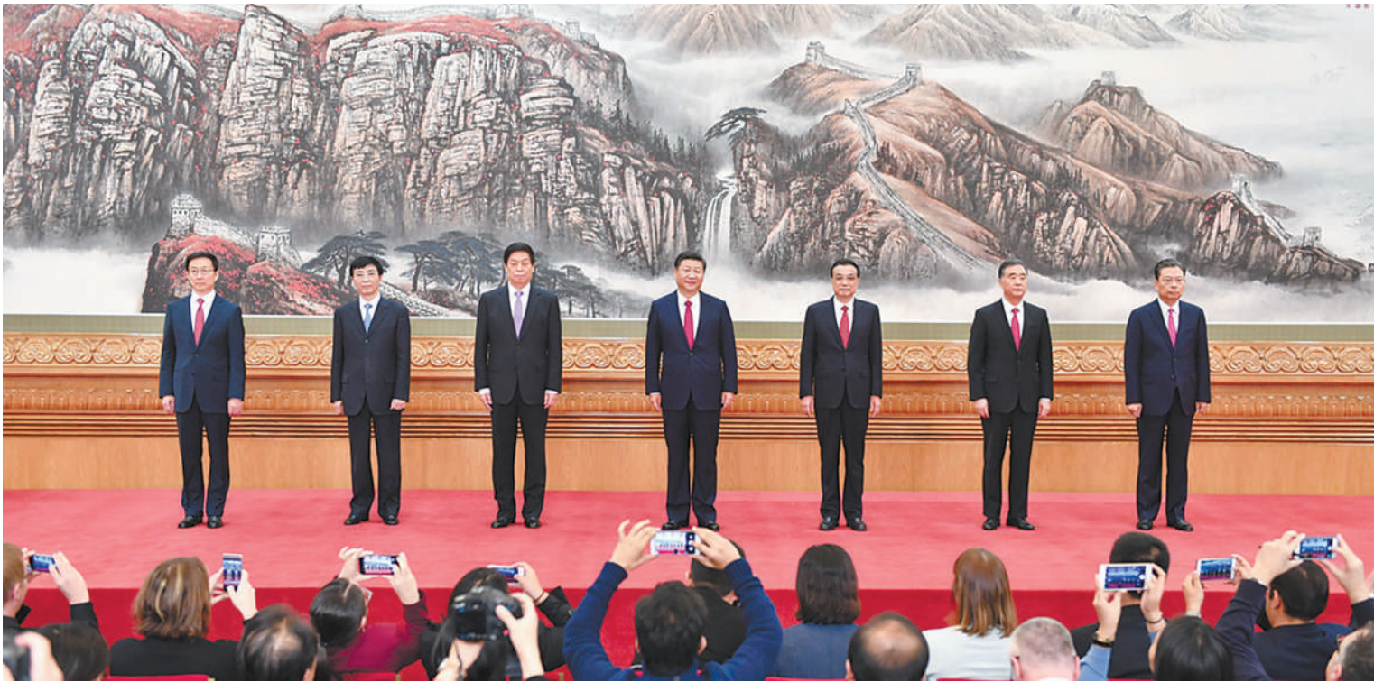
10月25日,刚刚在中共十九届一中全会上当选的中共中央总书记习近平和中央政治局常委李克强、栗战书、汪洋、王沪宁、赵乐际、韩正在北京人民大会堂同采访十九大的中外记者见面。习近平总书记发表讲话。