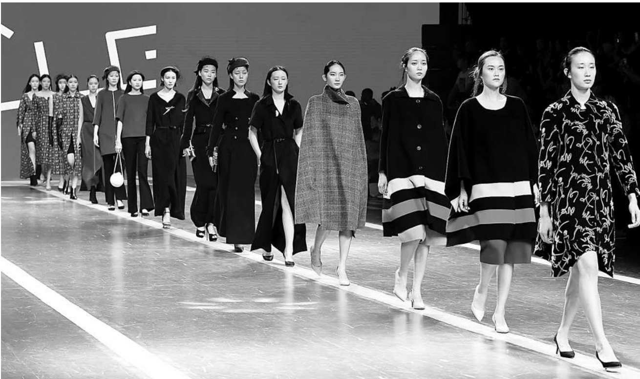
图为校企合作举办的秋冬时装发布会