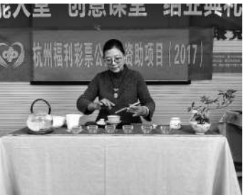
学员正在展示自己的茶艺。