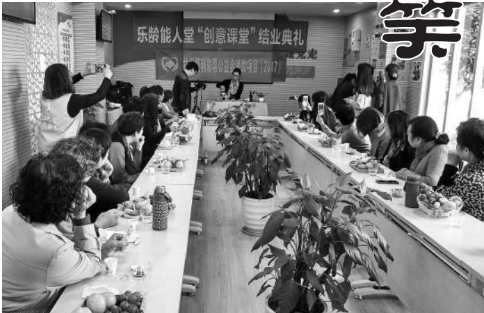
“创意课堂”结业典礼现场。