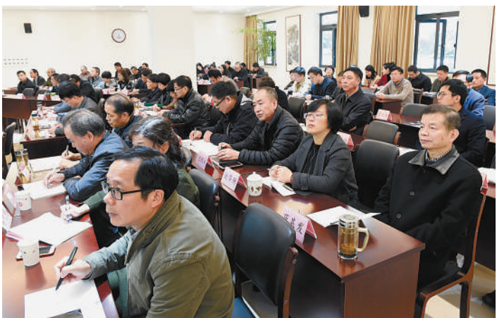
与会者认真听取专题讲座。