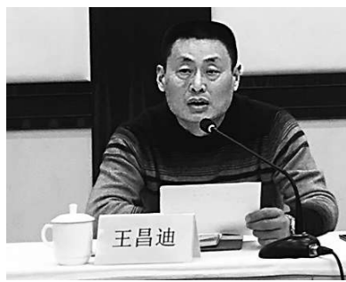
记者洪茵婷 通讯员李虹

会向辛勤工作在全县各条战线上的劳动模范、各级工会干部、广大会员和职工群众致以新春最诚挚的问候和最美好的祝福!