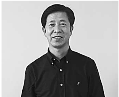
通讯员肖华 记者王海霞