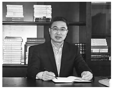
记者吴晓静 通讯员陈鸣旭