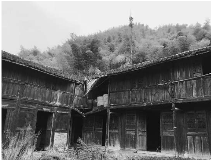
竹林掩映中的木屋。