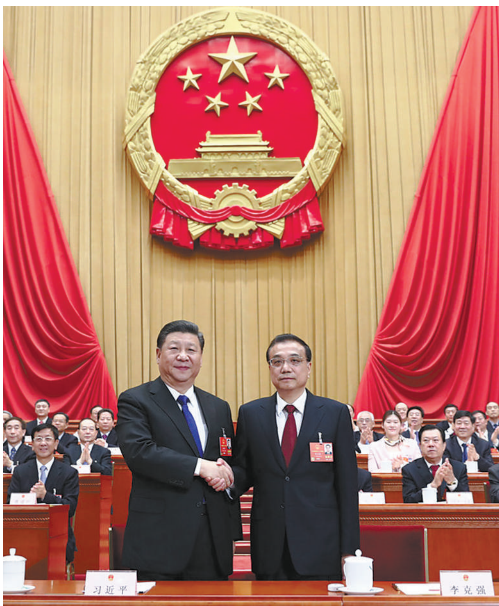
3月18日,十三届全国人大一次会议在北京人民大会堂举行第六次全体会议。根据国家主席习近平的提名,经过投票表决,决定李克强为中华人民共和国国务院总理。这是习近平同李克强亲切握手。

新华社北京3月18日电 十三届全国人大一次会议18日上午在人民大会堂举行第六次全体会议,根据国家主席习近平的提名,经过投票表决,决定李克强为中华人民共和国国务院总理。国家主席习近平签署第一号主席令,根据大会决定,任命李克强为国务院总理。