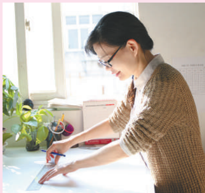
王小英 杭州简悦服饰有限公司

他是焊工,又是焊接工人的老师,将自己独道的焊接技巧、手法经验倾囊相授;是焊接工人的标杆,是学习的榜样,是公司最具实力又甘于奉献的焊接大师,其学徒在市焊工比赛中崭露头角。2006年、2010年两次获杭州市技能大赛焊工技能比赛第一名。2011年成立浙江省朱致挺技能大师工作室。2013年获杭州市首席技师称号。2017年参加“嘉克杯”国际焊接技能大赛,获得钨极氩弧焊第二名。参与《一种用于实现自动化焊接的焊枪夹持移动装置》获实用新型专利。主创《一汽焊接QC小组》荣获全国机械工业QC成果二等奖。