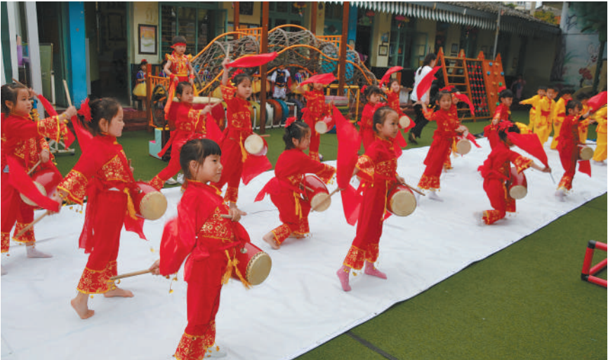
5月23日上午,五环市龙溪镇金色童年幼儿园里,锣鼓咚咚,舞安翩跹,民工子女正在学敲家乡湖北大鼓、山乡腰鼓,传承优秀传统文化,和谐融入第二故乡。