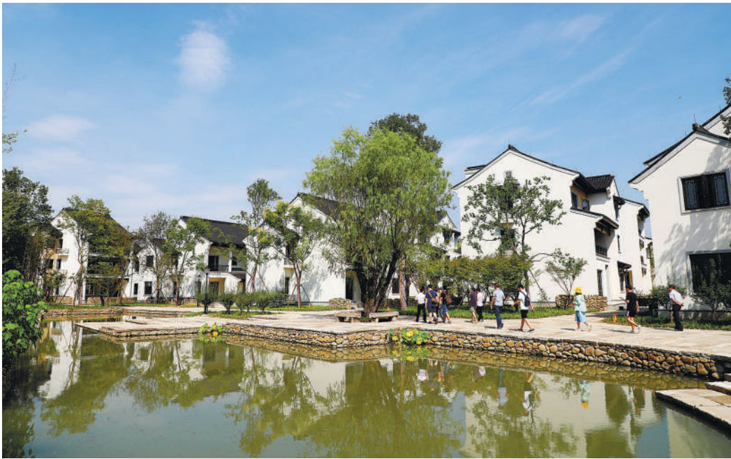
安吉县灵峰街道大竹园村的美丽蝶变,是习总书记“绿水青山就是金山银山”理念的实践成果,是浙江“千村示范万村整治”工程和美丽乡村建设的成功缩影。图为粉墙黛瓦与田园山水相映的新农居,犹如一幅水墨画。

如今的大竹园村突出“乡愁”情怀,合理规划生活功能区、文化展示区,打造“看得见山,望得见水,留得住乡愁”的江南田园村落。不仅如此,大竹园村主动将美丽宜居环境资源转化为乡村旅游经营资产,实施“合作社+农户”“公司+农户”等多元模式参与村庄经营。建立村企合作模式,流转土地1763亩,实施“蔬香大地”项目,发展集环境美化、休闲观光、采摘体验、农产品销售为一体的现代休闲观光农业业态。每年村集体及村民可获得土地经营权流转相关收入等近260万元。大竹园村的