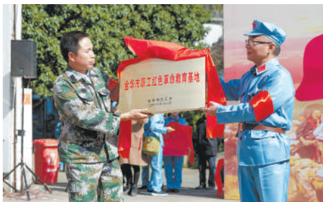
金华市职工红色革命教育基地授牌。

说到组织职工“重走红军路”,金华市总工会有关领导说,这其实是一份责任,一份使命。这次活动的主题是,“铭记革命史,不忘初心;迈向新时代,继续前行”,新时代的革命者肩负着伟大的使命。职工“重走红军路”,一方面是让广大职工铭记共和国的革命战争历史,缅怀革命先烈,另一方面,它对职工品格意志是一种磨练,弘扬红军精神,有利于锻造一支金华职工铁军队伍。当前,金华正在打造“信义金华、拼搏实干、共建图强”的新金华精神,工会要勇担使命,做新时代的工会标兵。 金华市总工会在东西村举行了“金华市职工红色革命教育基地”授牌仪式,“金华市职工摄影基地”授牌仪式,希望更多职工走进这里,接受革命理想教育。行前,金华市总工会还特意邀请中国青瓷学院摄影系主任