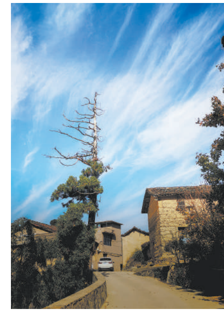
村口那棵沧桑古树见证往昔荣耀。

说到组织职工“重走红军路”,金华市总工会有关领导说,这其实是一份责任,一份使命。这次活动的主题是,“铭记革命史,不忘初心;迈向新时代,继续前行”,新时代的革命者肩负着伟大的使命。职工“重走红军路”,一方面是让广大职工铭记共和国的革命战争历史,缅怀革命先烈,另一方面,它对职工品格意志是一种磨练,弘扬红军精神,有利于锻造一支金华职工铁军队伍。当前,金华正在打造“信义金华、拼搏实干、共建图强”的新金华精神,工会要勇担使命,做新时代的工会标兵。 金华市总工会在东西村举行了“金华市职工红色革命教育基地”授牌仪式,“金华市职工摄影基地”授牌仪式,希望更多职工走进这里,接受革命理想教育。行前,金华市总工会还特意邀请中国青瓷学院摄影系主任