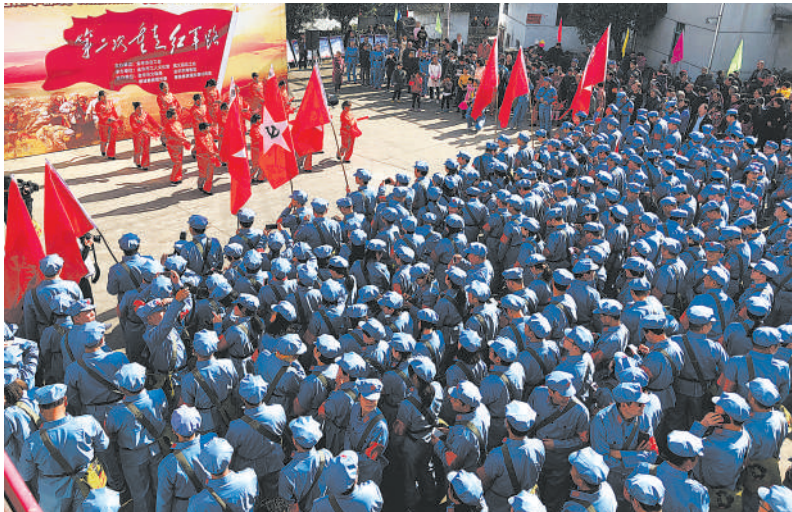
村民载歌载舞欢迎远方的客人。曾立新 摄

据了解,东西村不仅红色教育资源丰富,还拥有十分丰富的自然人文景观。东西村现有人口620余人,叶姓是村里第一大姓。从元代开始,松阳县卯山叶姓家族陆续迁居东西村。卯山叶姓家族钟情于东西村与其先祖唐代道士叶法善有关。东西村是叶法善每次从卯山