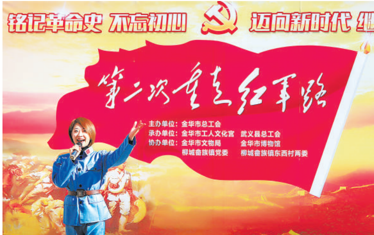
重走红军路,我们来了。