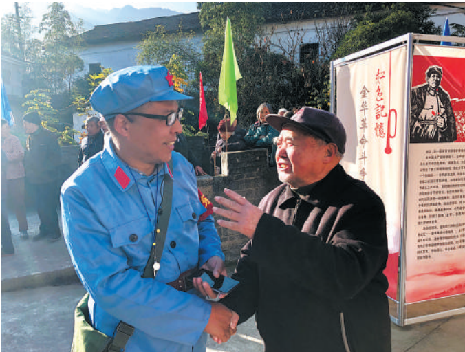
老人拉着新时代“红军”的手,感慨万千。