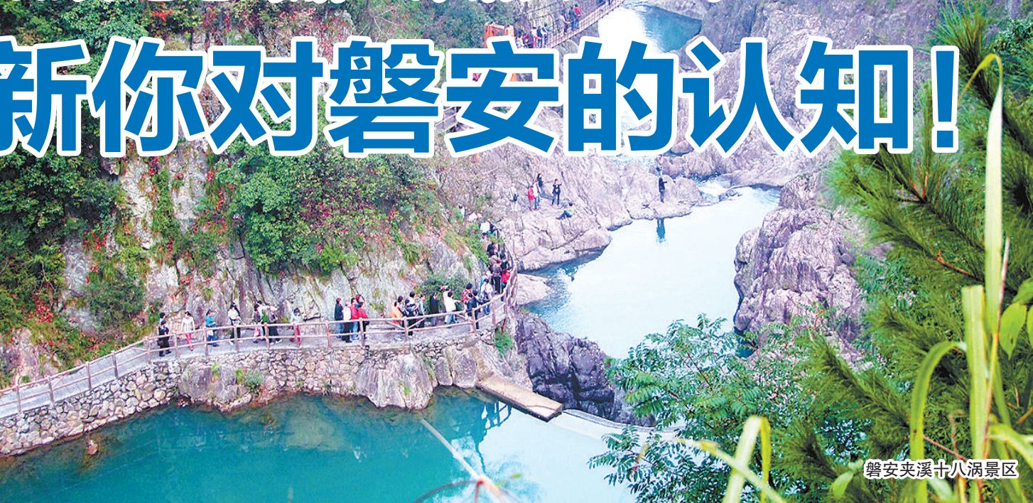
磐安夹溪十八洞景区