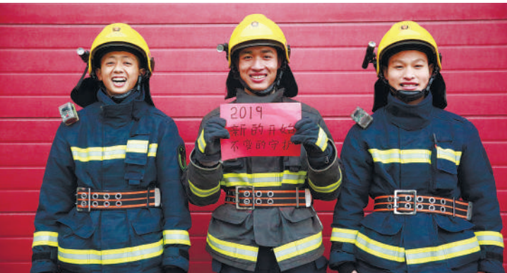
“2019,新的开始,不变的守护!”近日,义乌市消防支队的消防指战员们利用业余时间,通过手写