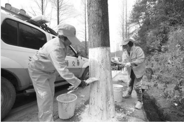
入冬以后,永康市公路养护站相继给行道树刷上由石灰、硫磺、盐混合而成的石灰浆,为行道树穿上了“冬装”。 林加强 徐锦清