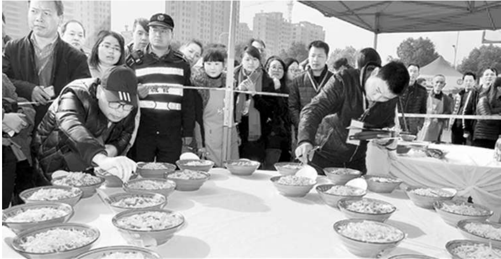
新昌炒年糕技能大赛现场。