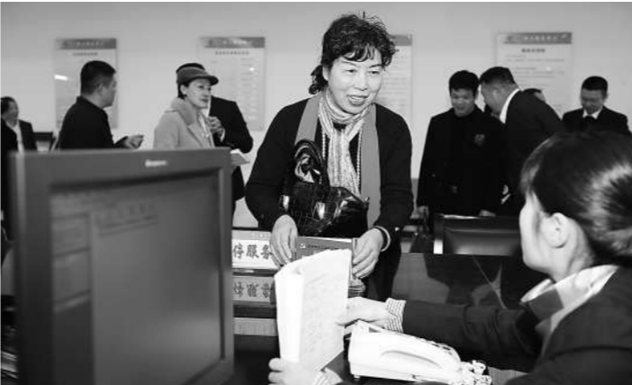
市民监督团代表在温州市职工服务中心了解“娘家人”日常工作。

通讯员夏婕好报道 困难职工如何寻求帮助?在岗职工与企业发生劳资纠纷找谁帮忙维权?职工医疗互助有哪些基本保障?近日,温州市总工会邀请市民监督团代表走进工会,近距离感受“娘家人”的日常工作状态和为职工提供的暖心服务。