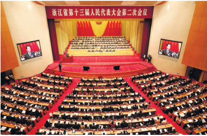
昨日上午,省十三届人大二次会议隆重开幕。

是改革开放40周年、“八八战略”实施15周年,是新一届政府的开局之年。面对错综复杂的外部环境和艰巨繁重的改革发展任务,在党中央、国务院和省委的坚强领导下,省政府坚持以习近平新时代中国特色社会主义思想为指导,全面贯彻党的十九大和十九届二中、三中全会精神,认真落实习近平总书记对浙江工作的重要指示,深入贯彻党的二十大精神,围绕“八八战略”再深化、改革开放再出发,全面落实省委各项决策部署和省十三届人大一次会议确定的目标任务,聚焦聚力高质量、竞争力、现代化,扎实推进富民强省十大行动计划,全力打好三大攻坚战,持续打好高质量发展