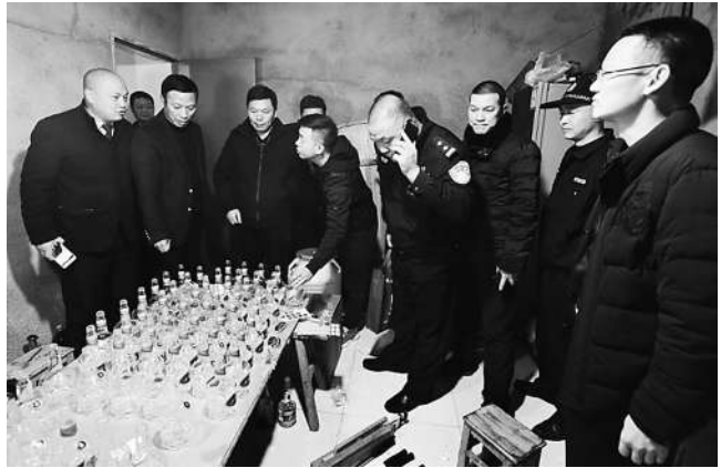
警方查获制作假酒现场

警方提醒:春节即将来临之际,广大市民需要购买烟酒走亲访友、聚餐庆祝,建议通过正规渠道购买;消费者发现假冒伪劣食品应及时向相关部门举报,涉嫌犯罪的要及时报告公安机关。